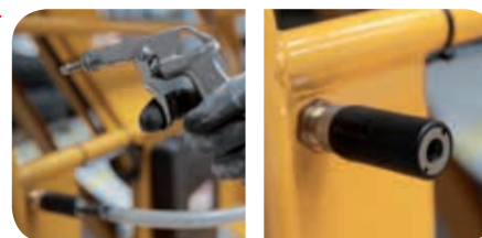
Подача воздуха к платформе