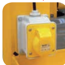
Силовая розетка на рабочей платформе